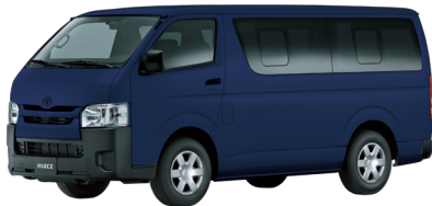
AZUL OSCURO MICA MET 8P4