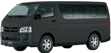
SILVER MICA MET 1E7