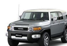
GRIS CEMENTO 2KY