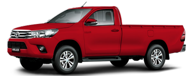
ROJO METÁLICO 3T6