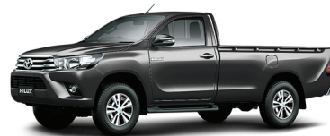
GRIS METÁLICO 1G3