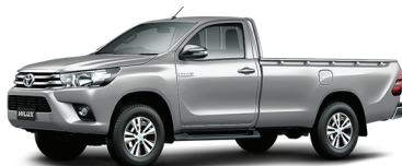
SILVER MEDIO 1D6