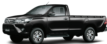
NEGRO ATTITUDE 218